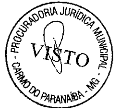
César Caetano de Almeida Filho Prefeito de Carmo do Paranaíba-MG

Carmo do Paranaíba - MG, 17 de julho de 2024.