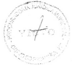
CÉSAR CAETANO DE ALMEIDA FILHO Prefeito do Município de Carmo do Paranaíba

Carmo do Paranaíba, 05 de setembro de 2020